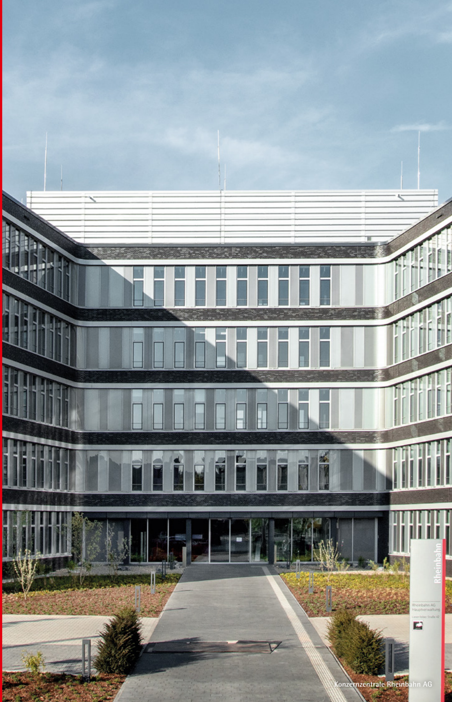
Konzernzentrale Rheinbahn AG